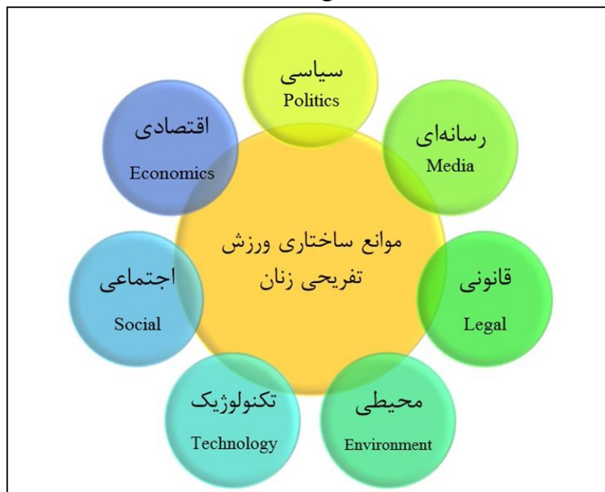
شکل ۱. مدل طراحی شده موانع ساختاری ورزش تفریحی زنان ایران