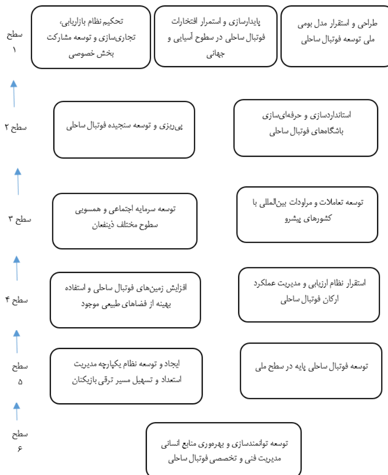
شکل 1. مدل ساختاری تفسیری تحقیق