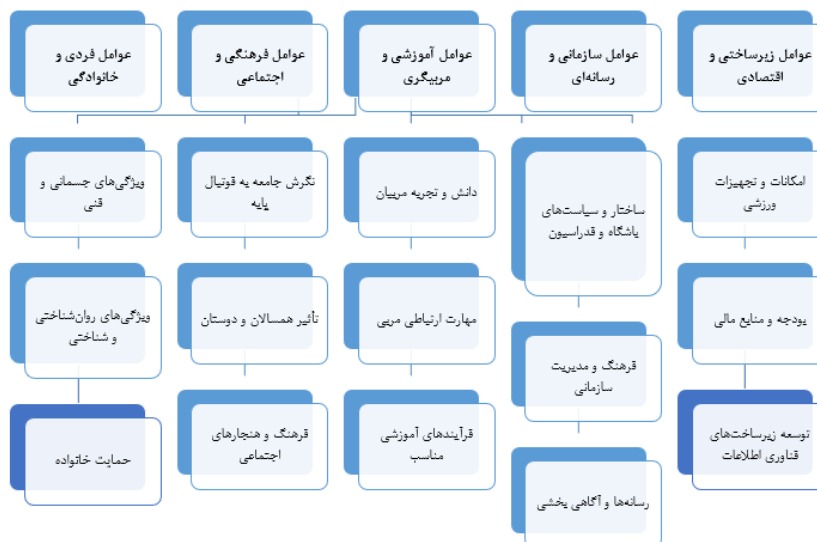
شکل ۱. عوامل مؤثر بر استعدادیابی فوتبال پایه